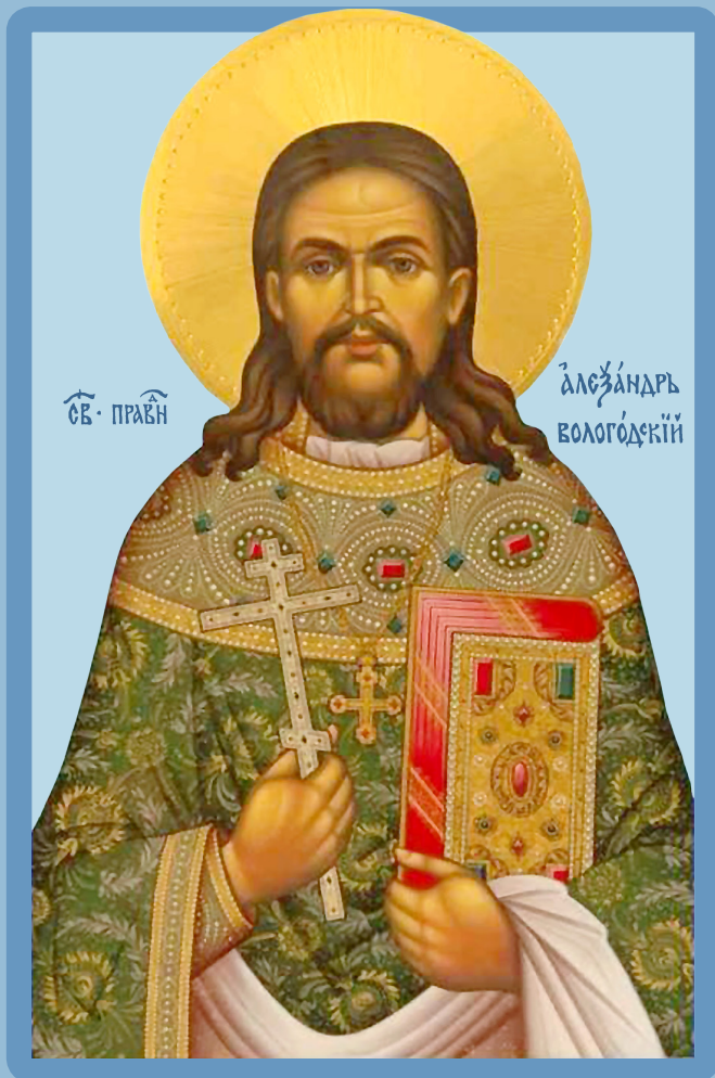
Святой праведный Александр Вологодский